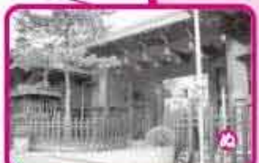
福岡市のあかぎ公園より移された長屋門