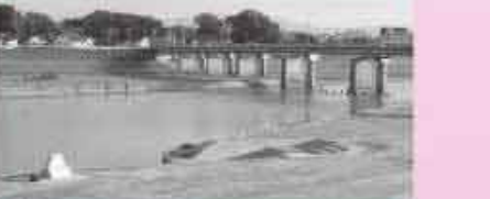
船着場・白蓮歌碑