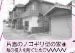
片島のノゴギリ型の家並 船の侵入を防ぐためのVVVV