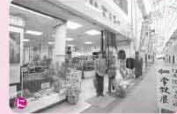
歌人白蓮想 伝右衛門と白蓮の資料を常設展示