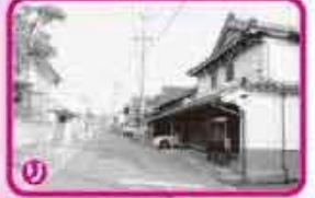
伝右衛門邸への入口(右側家屋二階壁に富士の巻狩りのコテ絵)