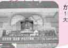
からくり時計 1時間ごとからくり人形が大名行列を再現(10:00-18:00)