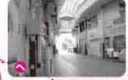
この道が内野宿へ