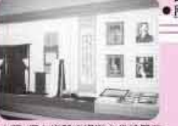
白蓮・伝右衛門の資料を常設展示