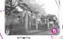
義相八幡宮の鳥居