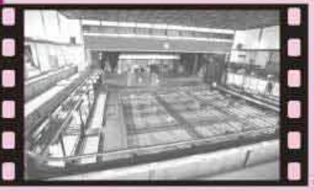
嘉穂劇場の廻り舞台と桟敷