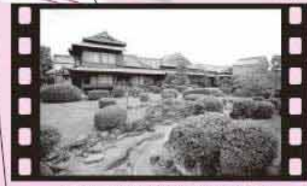
左側の二階が白蓮の邸内(館内設置より)